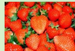
うきは果樹の村 やまんどん