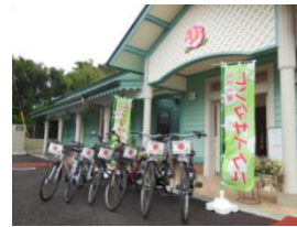
久留米市世界のつばき館