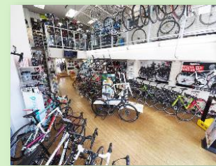
イワイスportsサイクル