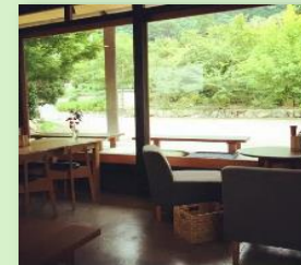
庭カフェ あかりや