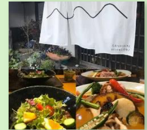
古民家カフェ山帰来