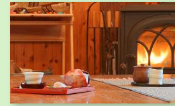
和紅茶とくろづの場 花音花夢