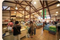
道の駅巡りも一興