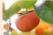
柿狩りも楽しめます