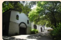
ワイナリーで非日常を